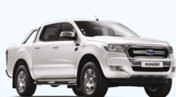
Blanco Oxford |