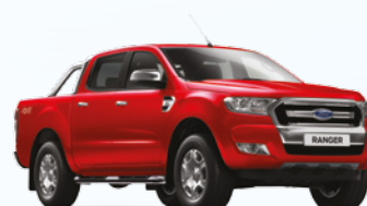
Rojo Bari |