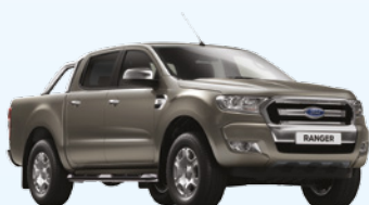
Gris Tectonic |