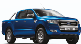
Azul Aurora |