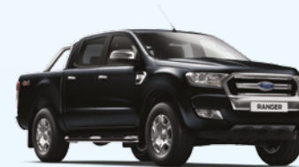
Negro Perlado |