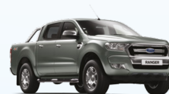
Gris Mercurio |