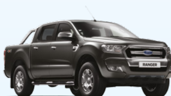
Gris Magnetic |