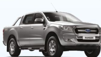
Plata Metalizado |